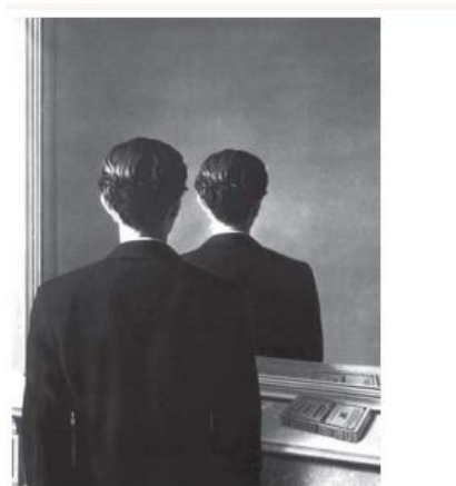
MAGRITTE, R. A reprodução proibida. Óleo sobre tela, 81,3 x 65 cm. Museum Boijmans Van Beuningen, Holanda, 1937.

O Surrealismo configurou-se como uma das vanguardas artísticas europeias do início do século XX. René Magritte, pintor belga, apresenta elementos dessa vanguarda em suas produções. Um traço do Surrealismo presente nessa pintura é o(a):