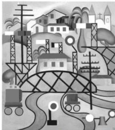
Tarsila do Amaral – Estação Central do Brasil EFCB – 1924. (foto reprodução)

“O modernismo no Brasil tem como marco simbólico a Semana de Arte Moderna, realizada em São Paulo no ano de 1922, e considerada um divisor de águas na história da cultura brasileira. O evento — organizado por um grupo de intelectuais e artistas por ocasião do Centenário da Independência — declara o rompimento com o tradicionalismo cultural associado às correntes literárias e artísticas anteriores”. (disponível em www.itaucultural.org.br )