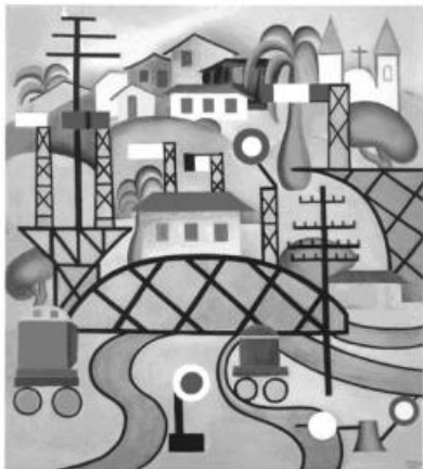
Tarsila do Amaral – Estação Central do Brasil EFCB – 1924. (foto reprodução)

“O modernismo no Brasil tem como marco simbólico a Semana de Arte Moderna, realizada em São Paulo no ano de 1922, e considerada um divisor de águas na história da cultura brasileira. O evento — organizado por um grupo de intelectuais e artistas por ocasião do Centenário da Independência — declara o rompimento com o tradicionalismo cultural associado às correntes literárias e artísticas anteriores”. (disponível em www.itaucultural.org.br )