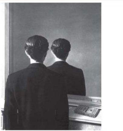
MAGRITTE, R. A reprodução proibida. Óleo sobre tela, 81,3 x 65 cm. Museum Boijmans Van Buningen, Holanda, 1937.

O Surrealismo configurou-se como uma das vanguardas artísticas europeias do início do século XX. René Magritte, pintor belga, apresenta elementos dessa vanguarda em suas produções. Um traço do Surrealismo presente nessa pintura é o(a):